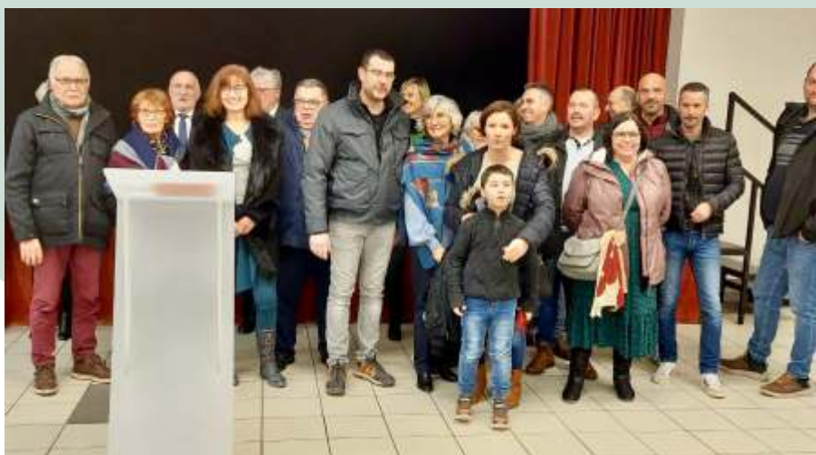
Accueil des nouveaux habitants.