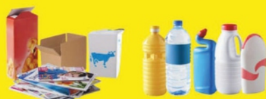
Papiers, emballages et briques en carton